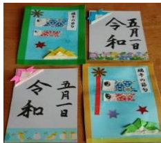
入所利用者様手 作りカード

5月1日(水)、新しい令和の幕開けをケアガーデン津山ではそれぞれの気持ちでお祝いしました。