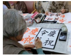
書道クラブで達筆を振るう