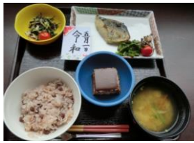
お祝い膳(チョコレ ートケーキ付き)