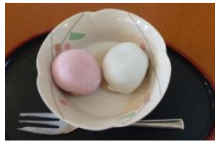
おやつは紅白饅頭