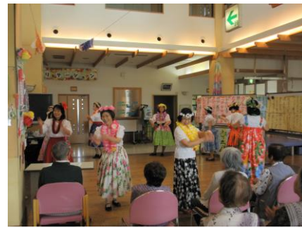
ふーちゃんとびーちゃん