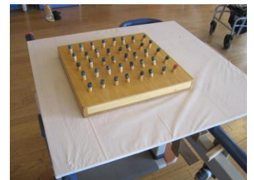
作業用のテーブルや自主訓練道具も大作業で作成しました。