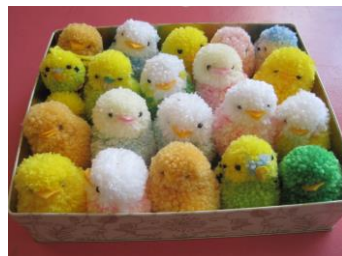
毛糸でプレゼント用のマスコットを作成します。