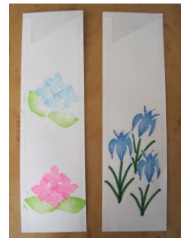
誕生日会の昼食用に箸袋を作成します。