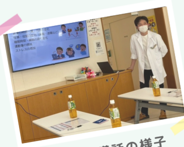
院長の講話の様子

4月5日(日)1型糖尿病患者会を開きました。今回のテーマは「血糖コントロールがうまくいかなかったときに考えること」でした。院長の講話の後、みんなでレクリエーションをして盛り上がりました！ きぼうの会では仲間(会員)を随時募集中です！