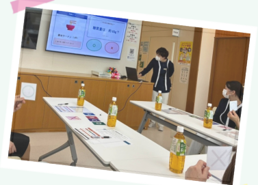
レクリエーションの様子